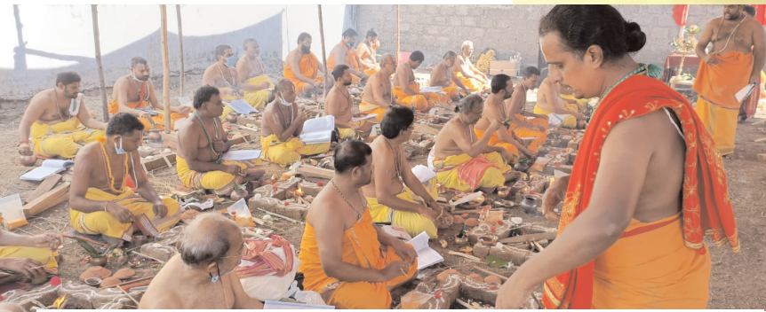
యాజ్ఞికపీఠంలో ప్రత్యక్ష హోమశిక్షణ