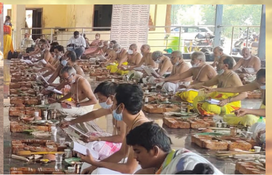
యాజ్ఞికపీఠం నేతృత్వంలో పెంబర్తిలో హోమశిక్షణ