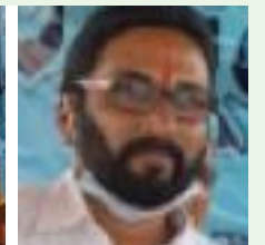
ఆవిష్కరణ మహోత్సవంలో ప్రసంగిస్తున్న వక్తలు