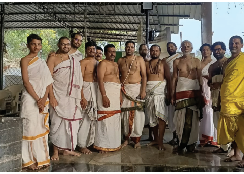
ఇసిఐఎల్ రంగనాథస్వామి దేవాలయంలో