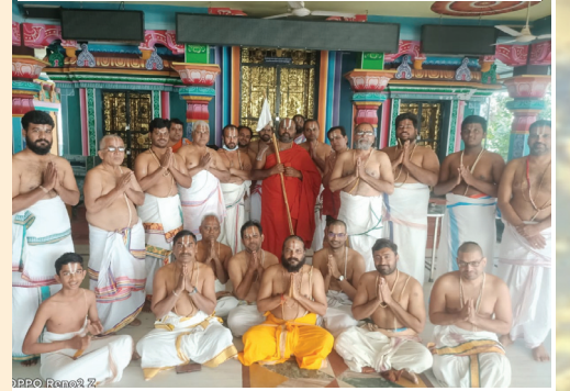
హైదరాబాద్లో హోమశిక్షణలో పాల్గొన్న వారికి ఆహోబిల స్వామి మంగళా శాసనాలు

ఋత్విక్ సమీకరణ అన్ని ప్రాంతాలలో జరుగుతోంది కరీంనగర్, హైదరాబాద్, నిజామాబాద్, విశాఖ, విజయవాడ ప్రాంతాలలో హోమశిక్షణలు జరిగాయి. యాజ్ఞికపీఠంలో గత మూడు సంవత్సరాలుగా హోమశిక్షణనిస్తున్న సందర్భాలు ఉన్నాయి. శ్వాస్ నేతృత్వంలో హోమశిక్షణ నిర్వహిస్తున్నారు