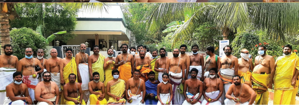
జీయర్ స్వామి ఆశ్రమంకు కరీంనగర్ వేదభవనం నుంచి విచ్చేసిన శ్రీవైష్ణవ స్వాములు