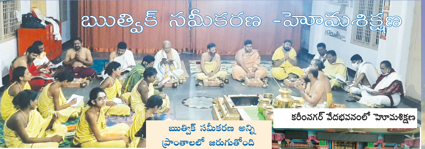
కరీంనగర్ వేదభవనంలో హోమశిక్షణ

ఋత్విక్ సమీకరణ అన్ని ప్రాంతాలలో జరుగుతోంది కరీంనగర్, హైదరాబాద్, నిజామాబాద్, విశాఖ, విజయవాడ ప్రాంతాలలో హోమశిక్షణలు జరిగాయి. యాజ్ఞికపీఠంలో గత మూడు సంవత్సరాలుగా హోమశిక్షణనిస్తున్న సందర్భాలు ఉన్నాయి. శ్వాస్ నేతృత్వంలో హోమశిక్షణ నిర్వహిస్తున్నారు