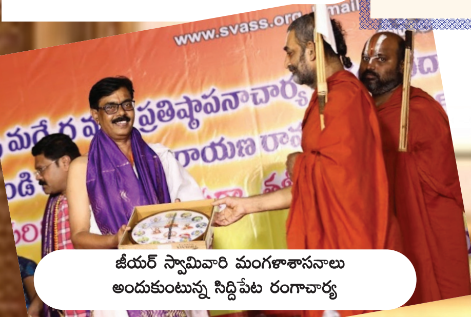
జీయర్ స్వామివారి మంగళాశాసనాలు అందుకుంటున్న సిద్దిపేట రంగాచార్య