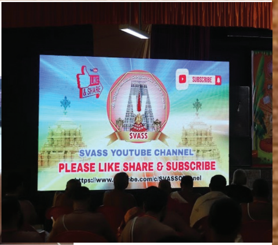
శ్వాస్ వెబ్ పేజీని ప్రారంభిస్తున్న శ్రీశ్రీశ్రీ త్రిదండి చిన్న శ్రీమన్నారాయణ రామానుజ జీయర్ స్వామి వారు