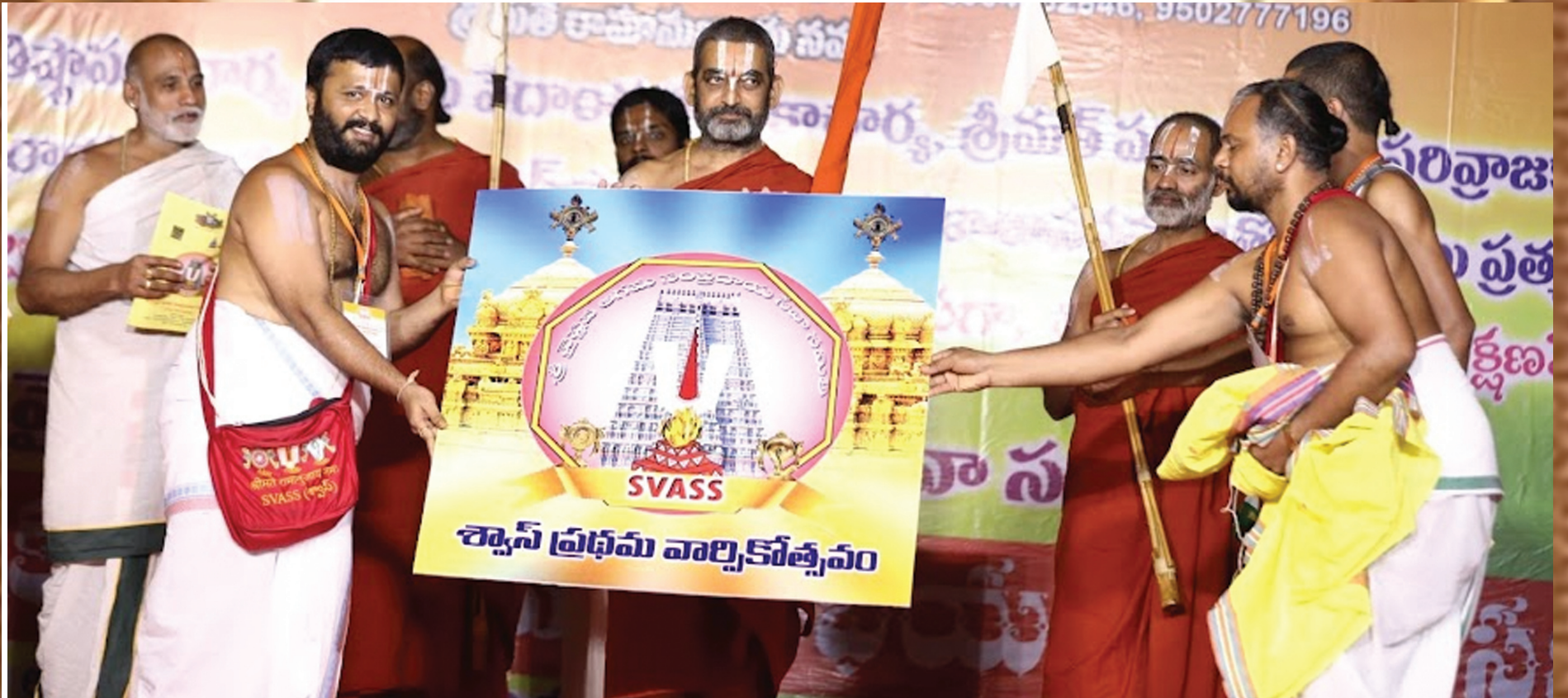
శ్వాస్ ప్రథమ వార్షికోత్సవ లోగో ఆవిష్కరిస్తున్న శ్రీశ్రీశ్రీ త్రిదండి చిన్న శ్రీమన్నారాయణ రామానుజ జీయర్ స్వామి వారు