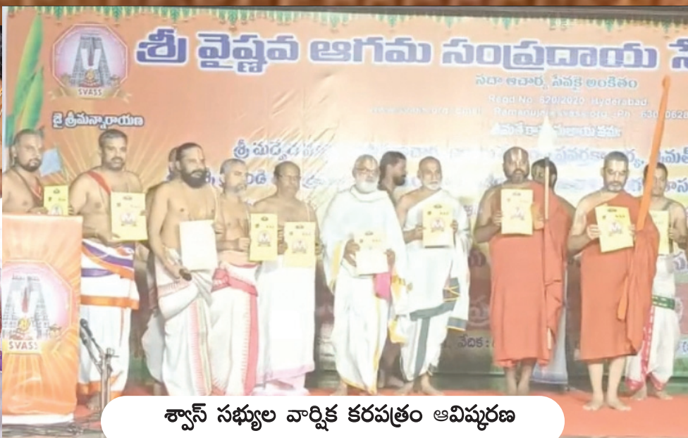
శ్వాస్ సభ్యుల వార్షిక కరపత్రం ఆవిష్కరణ