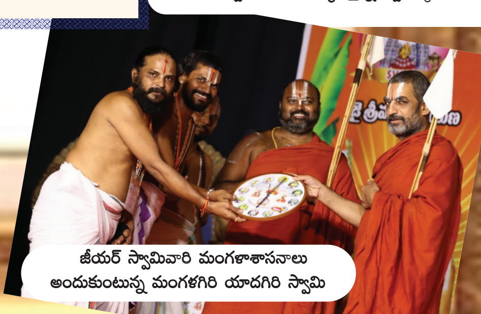
జీయర్ స్వామివారి మంగళాశాసనాలు అందుకుంటున్న మంగళగిరి యాదగిరి స్వామి