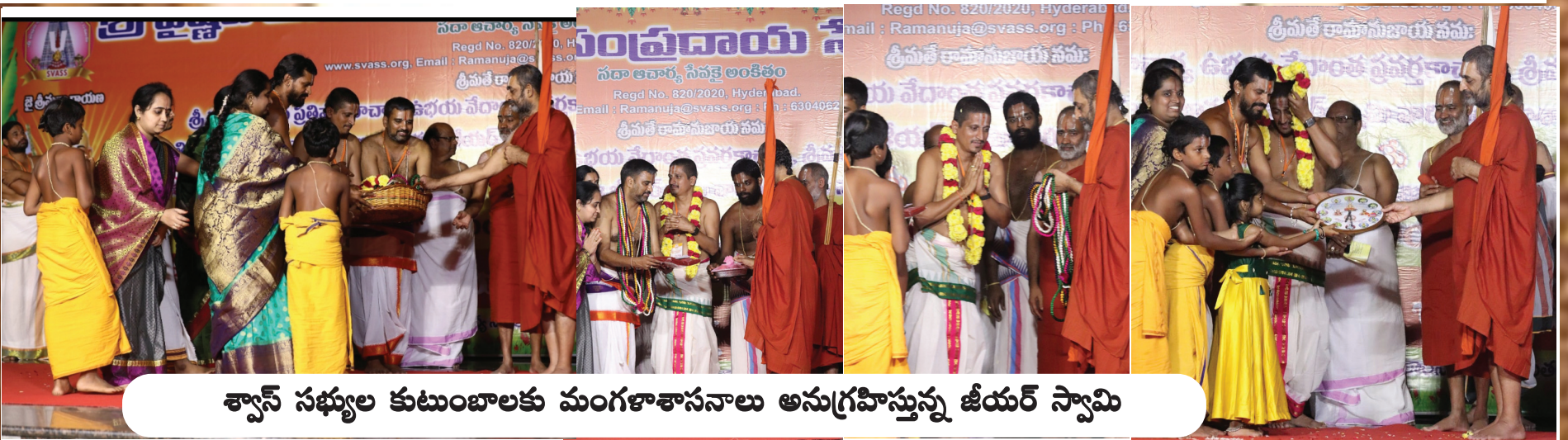
శ్వాస్ సభ్యుల కుటుంబాలకు మంగళాశాసనాలు అనుగ్రహిస్తున్న జీయర్ స్వామి