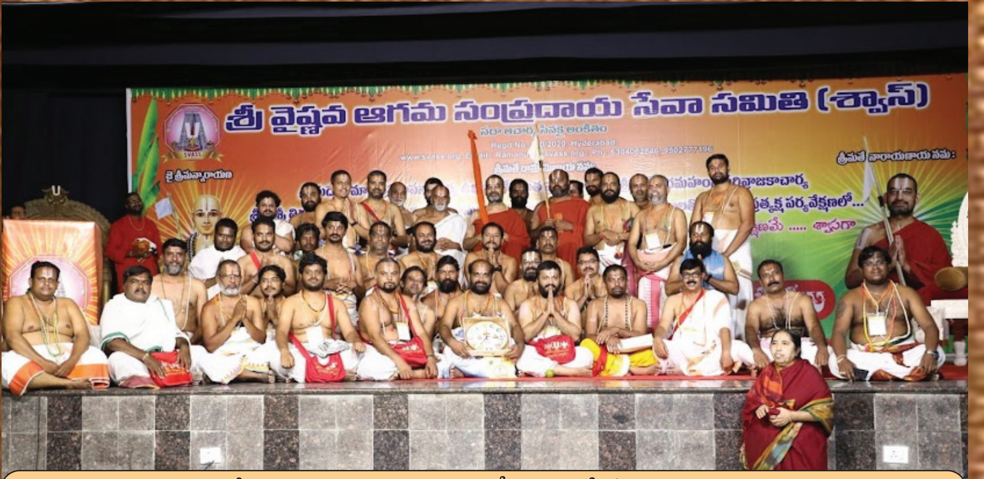
వేడుకల సందర్భంగా శ్వాస్ కమిటీ సభ్యులతో జీయర్ స్వాములు