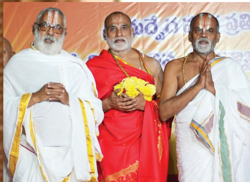
శ్వాస్ (శ్రీవైష్ణవ ఆగమ సంప్రదాయ సేవాసమితి) వార్షికోత్సవంలో.....

ఎందరెందరో భాగవతోత్తములకు శ్వాస్ వెర్రిక వేడుకల సందర్భంగా శ్రీయర్స్వాముల మంగళాశాసనాలు అందియి. ఎంతభార్యము చేసుకున్నవెయి... అనిత్రుతి శ్వాస్ సభ్యుని మదిలో అన్న స్పందన. ఆచార్య సన్నిధిలో పరమ భాగవతోత్తములు గోష్టికి విచ్చేసిన వేళ..!! ఆ దివ్యసుభూతిని గుండెలో పదిలంచేసుకుని సంఘటితంగా రోహిణులు సైనికుల్లా... సంప్రదాయ రక్షకుల్లా... ఆచార్య సేవలో తరిద్దెం అనిగొంతెత్తి చివిన వేళ... ఆ అనుభూతి అనిర్వచనీయం!!