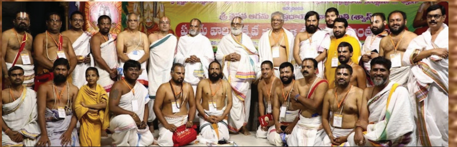
వార్షికోత్సవ వేడుకల సందర్భంగా పెద్దలతో శ్వాస్ బృందం