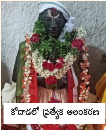
కోదాడలో ప్రత్యేక ఆలంకరణ